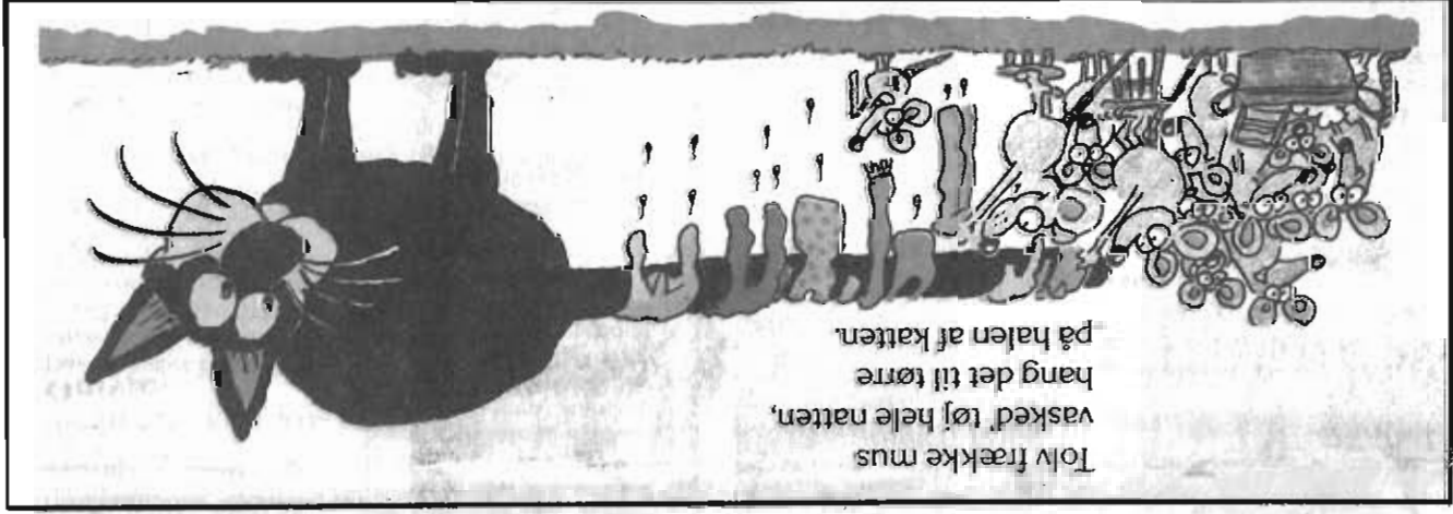
Tolv frække mus vasked' løj hele natten, hang det til tørre på halen af katten.