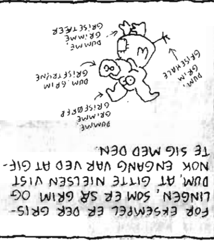
For eksempel er der gris- lingen, som er så grim og dum, at gitte Nielsen vist nok engang var ved at gif- te sig med den.