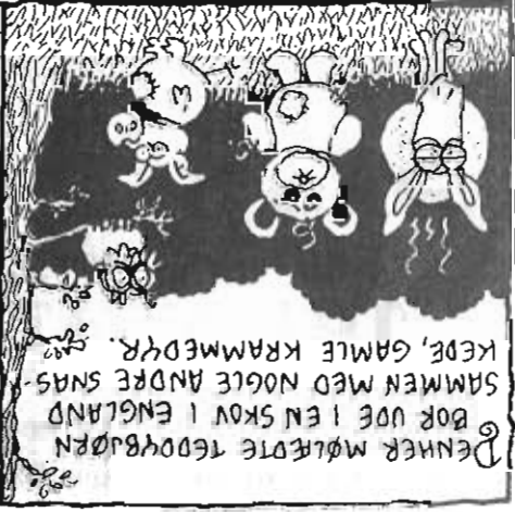
Denner mølde te dovrbuæn bor vøe i en skov i england sammen med nogle andre smås kepe, gamle krammedyr.

- Der er noget magisk ved vers. Man bliver tvunget til at bruge sproget anderledes, siger Rune Kilde.