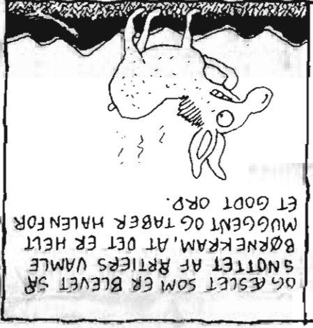
og æslet som er blevet så søt af artiers vable Børnekram, at det er helt muggent og taber halen for et godt ord.